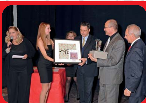
La premiazione della Compagnia di Ancona "Teatro del Sorriso" - anno 2011 per mano del Sindaco On. Sen. Giulio Marini.

Nel 2008, nello splendido scenario del Complesso Monumentale di Santa Croce a Firenze, espone per ben due mesi oltre 50 sculture, alcune monumentali, ottenendo grande successo di critica e di pubblico. Nel 2009 viene incaricato di completare, in bronzo delle porte laterali , della facciata del duomo di Viterbo che riceverà la benedizione di S.S. Benedetto XVI. Dal 1998 l'artista Joppolo conia ogni anno per il Festival di Viterbo le formelle in bronzo e il leone simbolo della città.